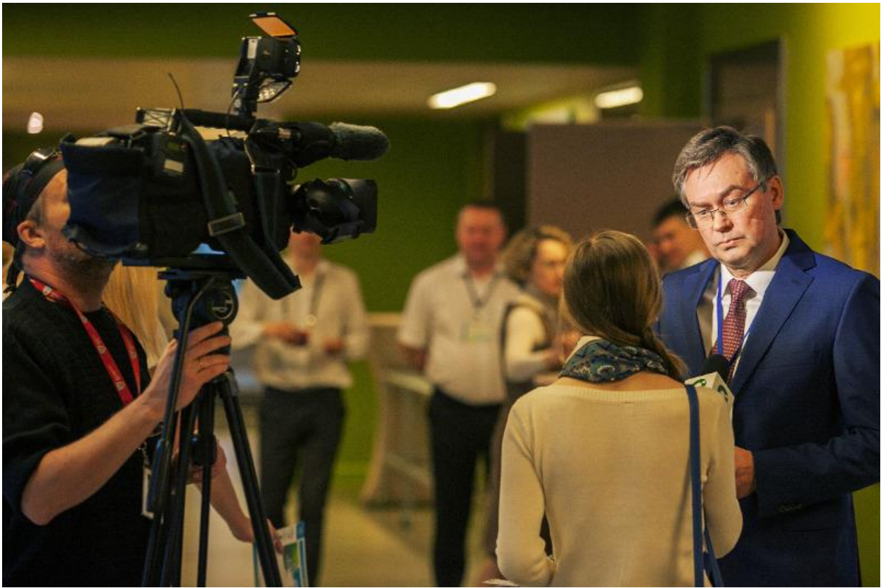
Симпозиум, день второй: