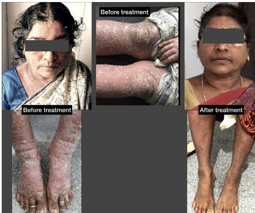
ФИГУРА 2 Случай 2 преди и след лечение на еритродермичен псориазис