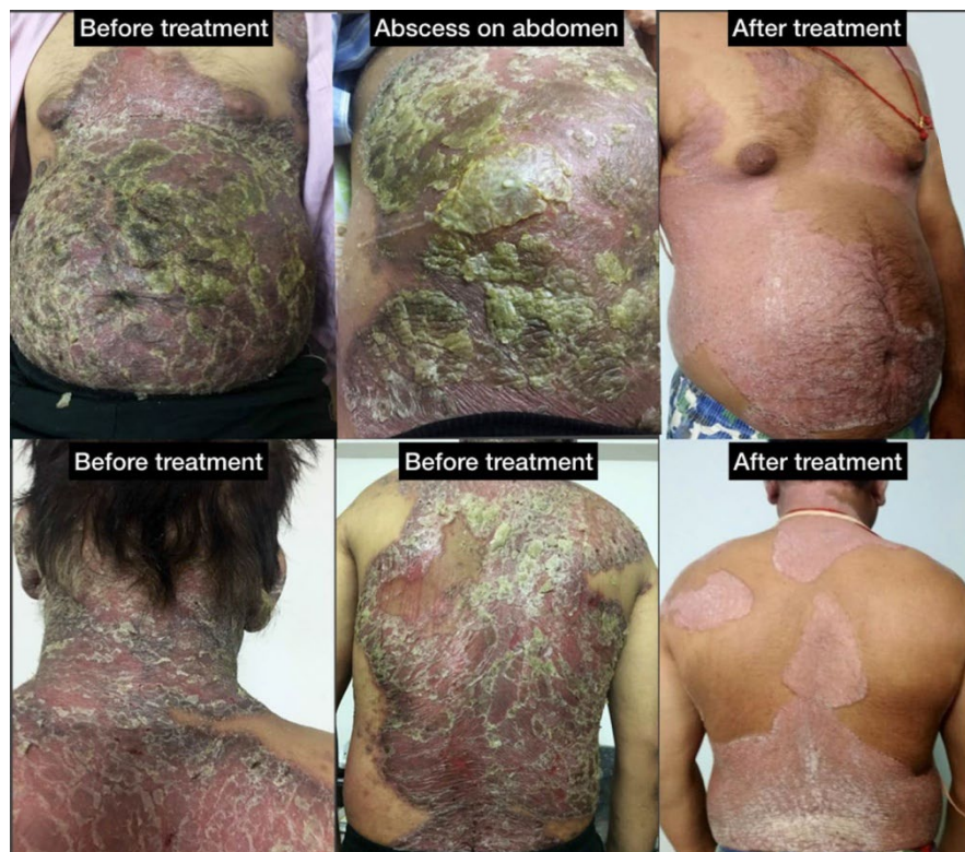
ФИГУРА 1 Случай 1 преди и след лечението на еритродермичен псориазис

придружени от неприятна миризма на телесни секрети, заедно с други патологични характеристики на сепсис, насочват лекаря хомеопат към това лекарство. Експертният опит в хомеопатията обаче е голямо ограничение в този случай и такива случаи не трябва да се разглеждат без предварителен опит. След като сепсисът се подобри обаче, псориазисните лезии продължават да бъдат обширни и изискват серия от лекарства, за да се видят промените, изобразени на Фигура 1