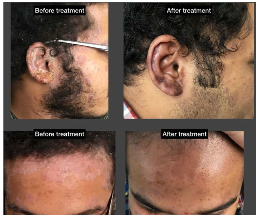
ФИГУРА 5 Случай 6 преди и след лечение на псориазис

Оценката на PASI резултата (Фигура 6) на тези случаи показва, че във всички тези случаи е постигнато значително изчистване на кожата. Ефектът от класическата хомеопатична терапия обаче е още по-изразен върху цялостното благосъстояние на пациента. Общото благосъстояние е един от най-важните фактори за лекаря хомеопат, за да оцени развитието на даден случай. Пациентите се оплакват от липса на благоприятни ефекти или влошаване на тяхното благосъстояние по време на терапията. Напротив, съпътстващите заболявания намаляват и общото състояние се подобрява. В три от случаите (случаи 1, 5 и 6) възпалителното състояние е оценено чрез кръвни тестове и е доказано, че е стабилно. Въпреки, че липсата на контрол и пристрастия към подбора затрудняват категоричното приемане на тази поредица от случаи