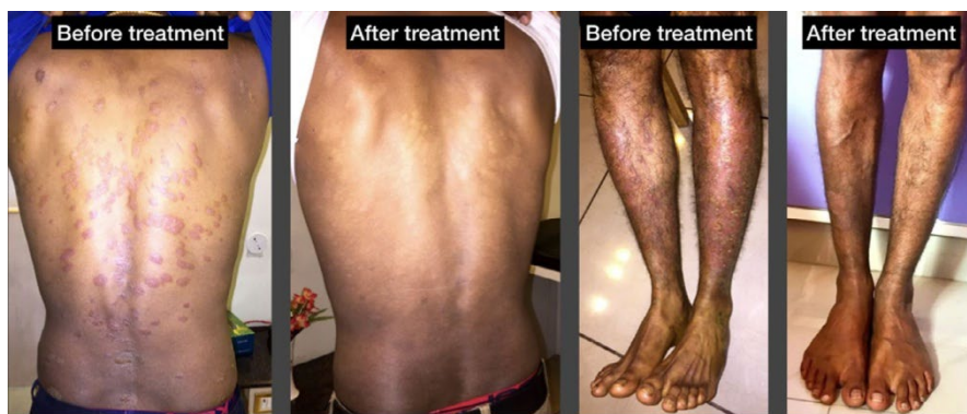
ФИГУРА 4 Случай 5 преди и след лекуване на псориазис

през ноември 2016 г. (Таблица 6, Фигура 5). Лезиите започват от скалпа и се разпространяват около и вътре в ушите.